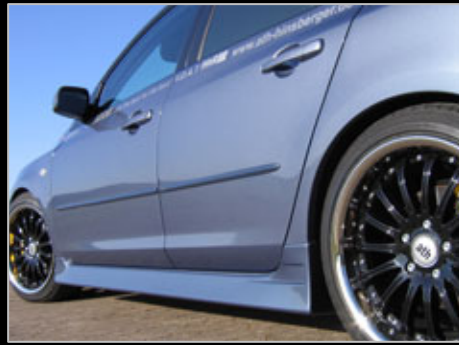
11686/87 Seitenschweller „Power3“ rechts + links Top-Qualität PU-Rim