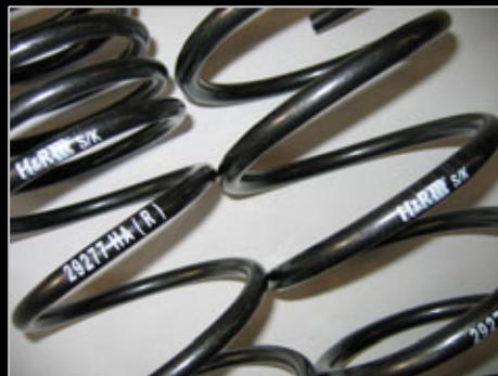
11657 SPORTFEDERNSATZ Tieferlegung ca. 35mm