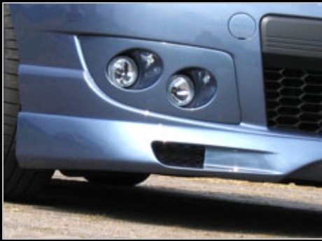
11661 Frontspoiler „Power3“ PU-Rim – TOP-Qualität...wird nur verklebt