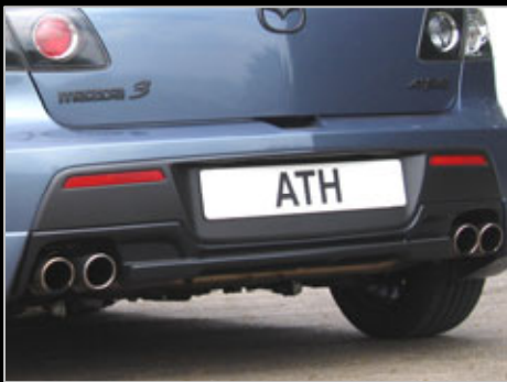
11662 Heckblende für 4-Rohranlage PU-Rim – TOP-Qualität...wird nur verklebt