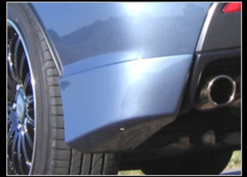
11663/64 Heckschürze „Power3“ rechts + links Top-Qualität PU-Rim