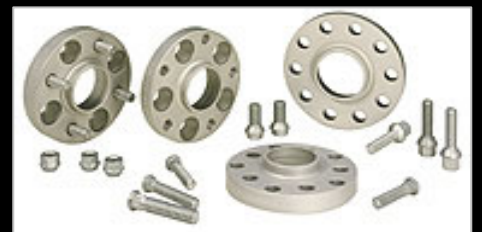
11207 DRS Spurverbreiterung mit Austausch der Stehbolzen (Inhalt: 2 Scheiben für 1 Achse incl. Austauschradbolzen) Verbreiterung: 30 mm – pro Achse.