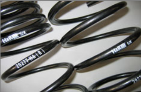
11506 Tieferlegungsfedern Tieferlegung 30mm Für alle Mazda 3F + S Benziner + Diesel