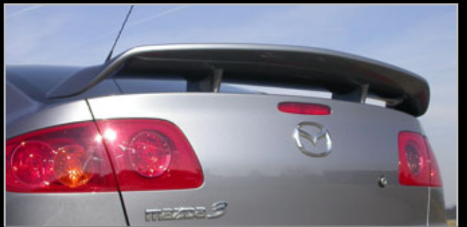
11209 Heckflügel „X-treme“ für M-3-Stufenheck